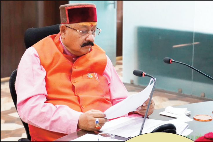
न्यूज़ वायरस नेटवर्क (आशीष तिवारी)

प्रदेश के लोक निर्माण मंत्री सतपाल महाराज ने लोक निर्माण विभाग के अधिकारियों के साथ समीक्षा बैठक की अध्यक्षता करते हुए अधिकारियों को स्पष्ट निर्देशित दिये कि योजना बनाते समय भाजपा के दृष्टि पत्र को अवश्य ध्यान में रखा जाए। उन्होंने चेतावनी देते हुए कहा कि बिना अनुमति के कोई भी अधिकारी कार्य ना करें। यदि कोई भी अधिकारी बिना अनुमति के कार्य करते हुए पाया गया तो उसके विरुद्ध कठोर कार्यवाही की जाएगी। लोक निर्माण मंत्री सतपाल महाराज ने समीक्षा बैठक में उच्च अधिकारी को निर्देशित करते हुए कहा कि लोक निर्माण विभाग में अधिकारियों कर्मचारियों के रिक्त पदों को तत्काल भरा जाए। उन्होंने कहा कि समीक्षा बैठक में जो भी निर्णय लिए जाते हैं