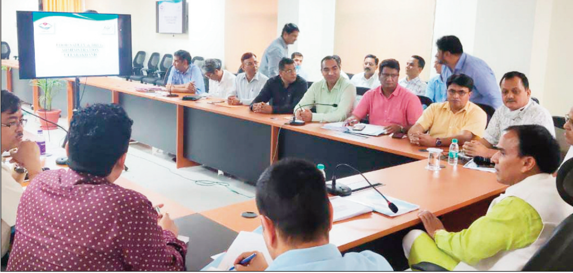
न्यूज़ वायरस नेटवर्क (आशीष तिवारी)

प्रदेश में खाद्य पदार्थों में मिलावटखोरी रोकने के लिए प्रभावी कदम उठाने के निर्देश दिये गये हैं, विशेषकर चार धाम यात्रा के मध्यनजर यात्रा मार्गों पर पड़ने वाले होटल एवं ढाबों में भोजन एवं अन्य खाद्य पदार्थों की गुणवत्ता सुनिश्चित करने के लिए अधिकारियों को नजर रखने को कहा गया है। विश्व खाद्य दिवस पर 'सुरक्षित खाद्य, बेहतर स्वास्थ्य' थीम को लेकर प्रदेशभर में तीन दिनों तक जनजागरूता अभियान चलाने का निर्णय लिया गया है।