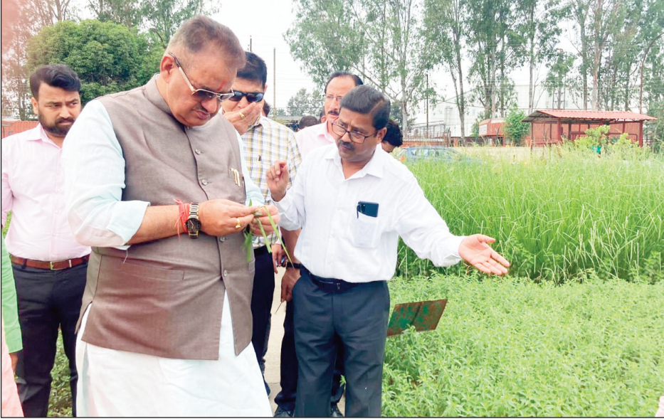
न्यूज़ वायरस नेटवर्क

कृषि मंत्री ने किसानों को वितरित किया भंगजीरे की उन्नत प्रजाति का बीज