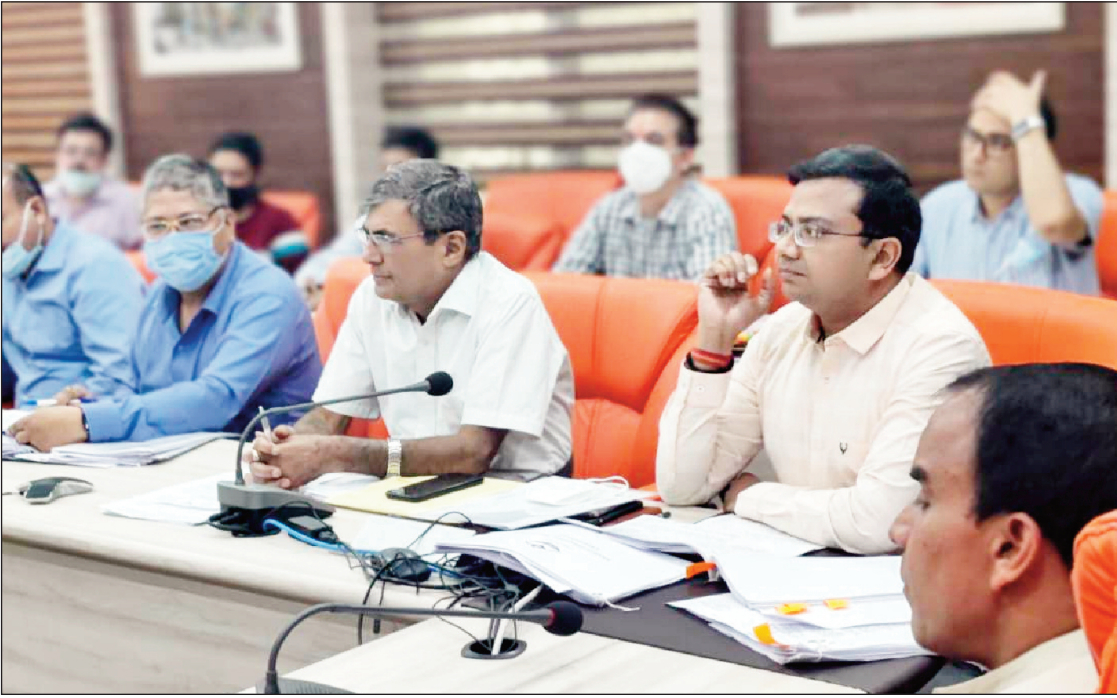
न्यूज़ वायरस नेटवर्क

सूबे में बुनियादी शिक्षा के ढांचे को और बेहतर बनाने के लिए प्राथमिक एवं पूर्व प्राथमिक विद्यालयों में मूलभूत सुविधाओं को सुदृढ़ किया जायेगा। एनईपी के अंतर्गत आंगनबाड़ी कार्यकर्त्रियों को विशेष प्रशिक्षण देकर आंगनबाड़ियों में बालवाटिका नाम से कक्षा-प्रारम्भ की जायेगी। बच्चों को पौष्टिक भोजन उपलब्ध कराने हेतु मध्याह्न भोजन