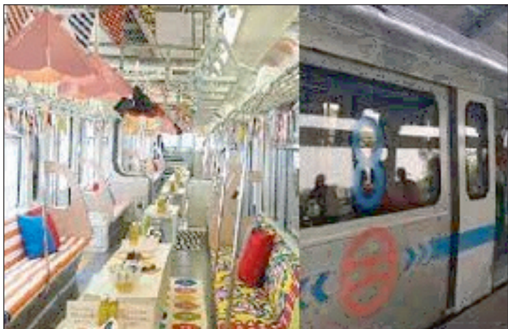
महविश फ़िरोज़ न्यूज़ वायरस नेटवर्क

अगर किसी ने ख़ाब देखा हो कि उसकी बर्थ-डे पार्टी या प्री-वेडिंग फोटो-वीडियो शूट किसी ट्रेन में फिल्मी स्टाइल में हो, तो अब यह संभव है। यह तस्वीर नोएडा मेट्रो की है, जिसमें पहली बार किसी सेलिब्रेशन को अनुमति दी गई। अब आप भी बर्थ-डे पार्टी या प्री-वेडिंग फोटो-वीडियो शूट के लिए नोएडा मेट्रो की बुकिंग करा सकते हैं। नोएडा मेट्रो रेल कॉरपोरेशन ने फरवरी 2020 में गैर-किराया बॉक्स राजस्वयानी किराए