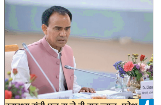
स्वास्थ्य मंत्री धन दा ने दी गुड न्यूज़, प्रदेश को मिलेंगे 245 एमबीबीएस डॉक्टर