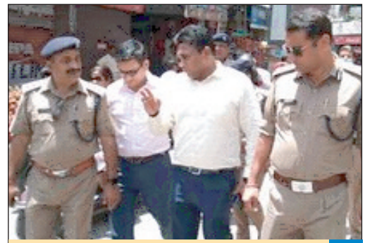
यैक यू डीएम डॉ आर. राजेश कुमार बाल शर्म पर किया बड़ा प्रहार