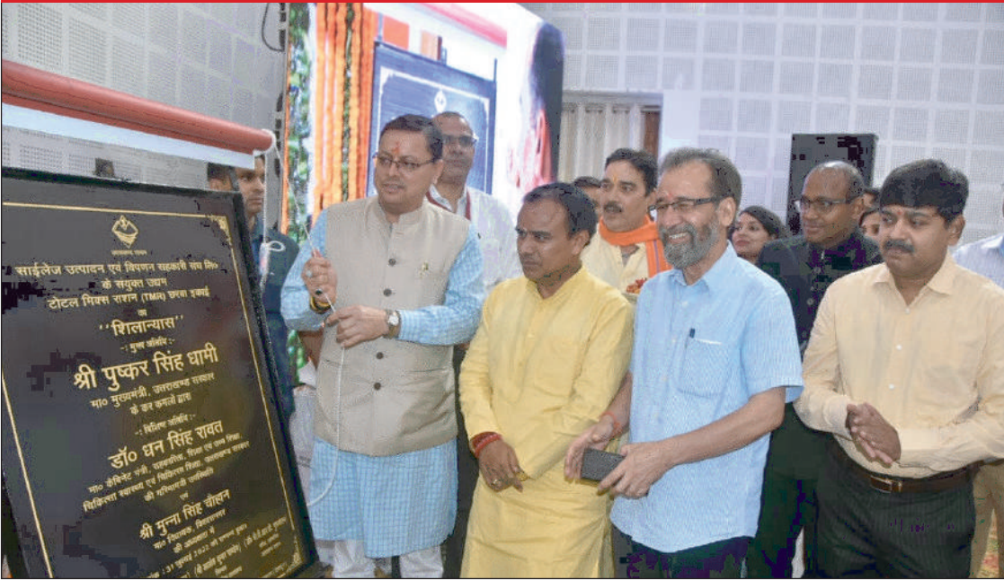
मो0 सलीम सैफ्री की रिपोर्ट न्यूज़ वायरस नेटवर्क

मुख्यमंत्री घस्यारी कल्याण योजना के अन्तर्गत टोटल मिक्स राशन (टीएमआर) यूनिट का भी मुख्यमंत्री ने किया शिलान्यास