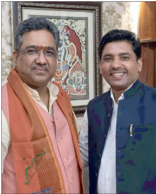
न्यूज़ वायरस नेटवर्क

देवबंद मे जुटेंगे भाजपा अल्पसंख्यक मोर्चा के कार्यकर्ता तिरंगा यात्रा की तैयारियां जोरो पर