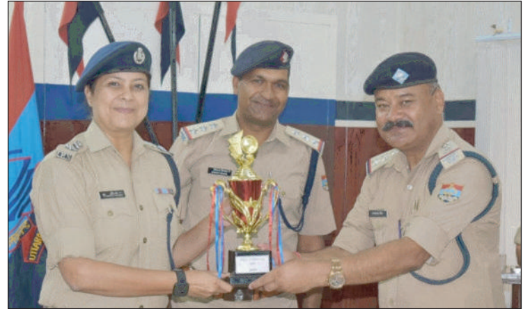
सामाजिक/सांस्कृतिक कार्यों में सहभागिता की सराहना व प्रशंसा की और भविष्य में इसी