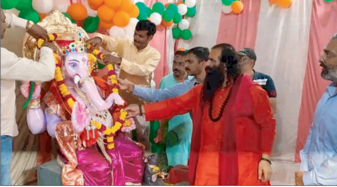
न्यूज़ वायरस नेटवर्क

देहरादून, 31 अगस्त। प्रदेशभर में बुधवार को गणेश चतुर्थी की धूम रही। जगह-जगह भगवान श्री गणेश की प्रतिमा की स्थापना के साथ गणेश महोत्सव की शुरुआत हुई। म्हारे घर में पधारो गजानंद भजनों की गूंज के साथ मूर्ति एवं प्रतिमा के साथ शोभायात्रा निकाली गई। इस दौरान गणेश मंदिरों को आकर्षक ढंग