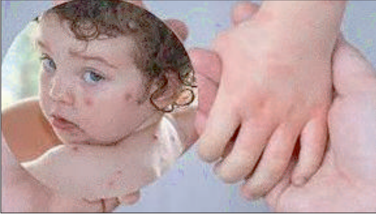
महविश की रिपोर्ट न्यूज़ वायरस नेटवर्क

देश में अभी कोरोना और मोंकीपॉक्स का खतरा तला भी नहीं है और अब टोमैटो फ्लू को लेकर स्वास्थ्य मंत्रालय चिंतित है और कई राज्यों को अलर्ट पर रखा गया है। इसे खतरनाक बनने से रोकने के लिए अब स्वास्थ्य विभाग द्वारा जागरूकता अभियान भी चलाया जा रहा है। फ्लू के अन्य मामलों की तरह यह भी संक्रामक है। लिहाजा आपको जानना जरूरी है कि इस अनजान दुश्मन से कैसे बचा जा सकता है