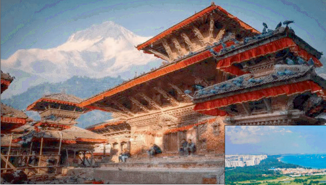
महविश की रिपोर्ट न्यूज़ वायरस नेटवर्क

देहरादून 16 सितंबर, हिंदी भाषी लोगों को कई बार देश से बाहर की ट्रिप प्लान करने में गहन चिंतन करना पड़ जाता है कि कोई उनकी भाषा समझने वाला उन्हें मिलेगा भी या नहीं। इस चिंता में कई बार बहुत से बने बनाए प्लान भी कैसल करने पड़ जाते हैं। लेकिन, चलिए हिंदी दिवस के इस अवसर पर जानते हैं कि भारत के अलावा ऐसे कौनसे देश (Hindi Speaking Countries) हैं जहां अच्छीखासी संख्या में लोग हिंदी भाषी हैं। आप इन देशों की सैर के लिए भी निकल सकते हैं।