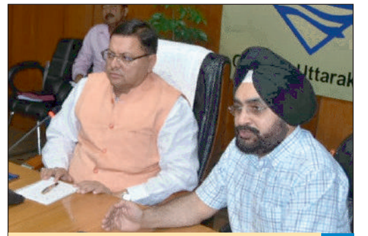
मुख्यमंत्री ने की प्रदेश की कानून व्यवस्था की समीक्षा, दिए ताबड़तोड़ निर्देश