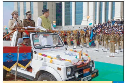
गौरसैण में चमोली पुलिस की भव्य रैतिक परेड की सीएम धामी ने ली सलामी