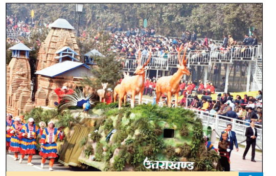
गणतंत्र दिवस परेड में कर्तव्य पथ पर उत्तराखंड की झांकी ने प्रथम स्थान पाकर बनाया इतिहास