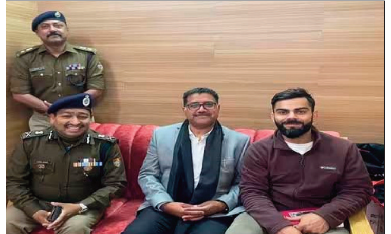
पहुंचने से पहले ट्रैफिक प्लान को परखा भी जाएगा। वहीं, उन्होंने जोशीमठ आपदा से चारधाम यात्रा को जोडकर अफवाह फैलाने वालों से सतर्क रहने की अपील की है। बताया कि फिल्हाल सभी यात्रा मार्ग सुरक्षित हैं। कहीं कोई दिक्कत होती है, इसे पुलिस के माध्यम से भी सार्वजनिक किया जाएगा।

न्यूज़ वायरस नेटवर्क ऋषिकेश। मई और जून में प्रस्तावित जी-20 सम्मेलन को लेकर पुलिस प्रशासन ने भी सुरक्षा से जुड़ी तैयारियों को पूरा कर लिया है। मेहमानों की सुरक्षा के लिए निगरानी प्वाइंट चिह्नित किए गए हैं। पुलिस वीवीआईपी आवागमन के लिए ट्रैफिक प्लान भी तैयार कर चुकी है। दयानंद आश्रम में क्रिकेटर विराट कोहली से मुलाकात करने पहुंचे डीजीपी अशोक कुमार ने यह जानकारी दी। उन्होंने बताया कि सरकार के दिशा-निर्देशों के तहत पुलिस ने जी-20 सम्मेलन में पहुंचने वाले मेहमानों की सुरक्षा का खाका तैयार कर लिया है।