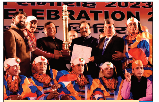
उत्तराखण्ड की झांकी को देश में प्रथम स्थान के लिये किया गया पुरस्कृत

उत्तराखण्ड से जुड़ रहे हिमाचल कांस्टेबल भर्ती धांधली के तार