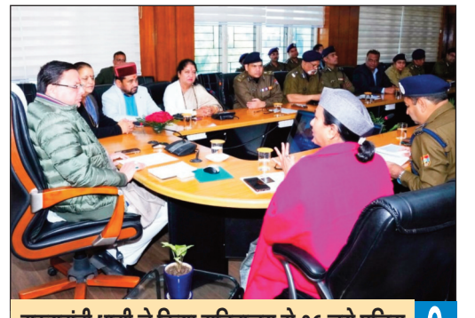
मुख्यमंत्री धामी ने किया सचिवालय से 06 नये पुलिस थानों एवं 20 पुलिस चौकियों का वर्चुअल उद्घाटन