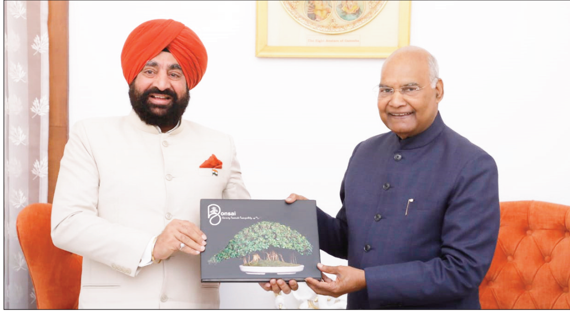
राज्यपाल गुरमीत सिंह ने की नई दिल्ली में पूर्व राष्ट्रपति रामनाथ कोविंद से शिष्टाचार भेंट

सचिव श्री राज्यपाल ने पुष्प प्रदर्शनी के दौरान राजभवन परिसर में साफ-सफाई और पर्याप्त मात्रा में कूड़े-दान की व्यवस्था करने के निर्देश दिये। वसन्तोत्सव में आने वाले आगन्तुकों हेतु पीने के पानी की समुचित व्यवस्था सहित मोबाईल टॉयलेट आदि की व्यवस्था समय से पूर्ण करने के भी निर्देश अधिकारियों को दिये।