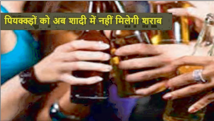
पियक्कड़ों को अब शादी में नहीं मिलेगी शराब