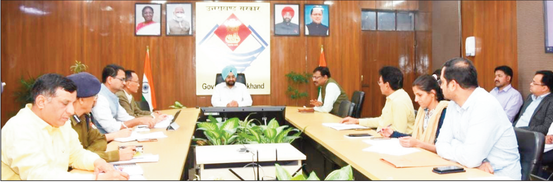
न्यूज़ वायरस नेटवर्क

देहरादून। मुख्य सचिव डॉ. एस.एस. संधु ने गुरुवार को सचिवालय में देहरादून में यातायात संकुलन को कम करने हेतु सभी सम्बन्धित विभागों के साथ बैठक की। मुख्य सचिव ने कहा कि जिलाधिकारी की अध्यक्षता में सभी सम्बन्धित विभागों की एक कमेटी बनायी जाए, जो ट्रेफिक कन्जेशन को कम करने के लिए प्रत्येक सप्ताह बैठक आयोजित करेगी।