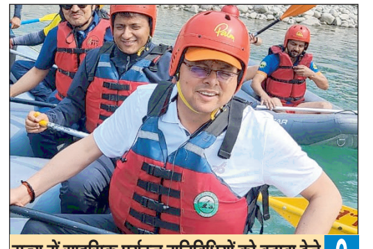
राज्य में साहसिक पर्यटन गतिविधियों को बढ़ावा देने के मकसद से खुद राफ्टिंग करने उतरे मुख्यमंत्री