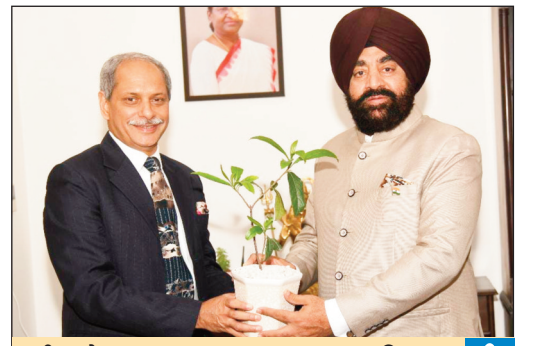
चीफ पोस्टमास्टर जनरल, उत्तराखण्ड अमिताभ खर्कवाल ने की राज्यपाल से शिष्टाचार भेंट