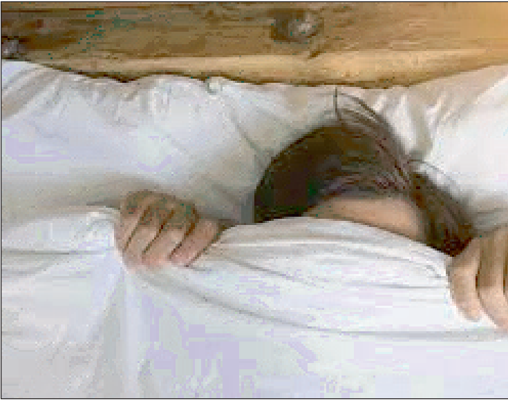
न्यूज़ वायरस नेटवर्क

11 मार्च : अच्छे स्वास्थ्य के लिए अच्छी नींद होना जरूरी है। लेकिन अच्छी नींद कितने घंटे की हो। इसपर डॉक्टरों का अलग अलग मत है। कुछ डॉक्टरों का कहना है कि रात को 7 से 8 घंटे जरूर सोना चाहिए। वहीं, कुछ डॉक्टर कहते हैं कि 7 से 8 घंटे में एक से दो घंटे ऐसे जरूर होने चाहिए। जहां आप गहरी निद्रा में हो। तब स्लीप साइकल पूरी मानी जाती है। मसलन रात को आप बेड पर सोने के लिए जाते हैं, मगर उससे पहले आप