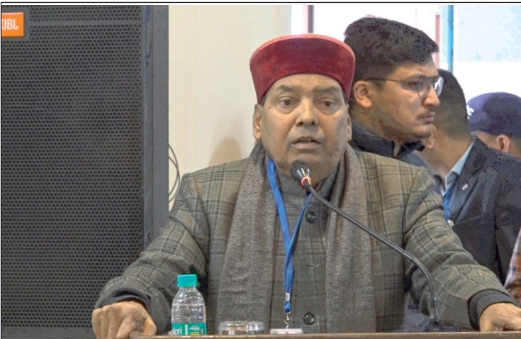
न्यूज़ वायरस नेटवर्क

बढ़ते वाहन और इस से बढ़ते प्रदूषण और समाधान को ध्यान में रखते हुए 'देहरादून में मोटर वाहन प्रदूषण और परिवहन का भविष्य' विषय पर आरटीओ में एक सेमीनार और प्रदर्शनी का आयोजन किया गया। जिसमें कई कॉलेजों के ऑटोमोबाइल