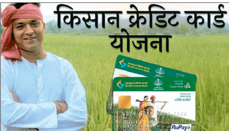
न्यूज़ वायरस नेटवर्क

भारत सरकार द्वारा संचालित किसान क्रेडिट कार्ड योजना पशुपालन और मत्स्य पालन गतिविधियों के लिए पात्र लाभार्थियों को अल्पकालिक ऋण प्रदान करती है। पूर्व में किसान क्रेडिट कार्ड का उपयोग कृषि कार्यों से सम्बन्धित गतिविधियों हेतु किया जाता था, परन्तु वर्तमान में किसान क्रेडिट कार्ड योजना द्वारा पशुपालन एवं मत्स्य पालन से सम्बन्धित गतिविधियों हेतु लाभार्थियों को अल्पकालिक ऋण प्रदान किया जाता है। किसान क्रेडिट कार्ड योजना के लिए 1.60 लाख रुपये तक किसी भी परिसम्पत्ति को बंधक रखने की आवश्यकता नहीं है। बैंकों द्वारा निर्धारित अवधि में ऋण