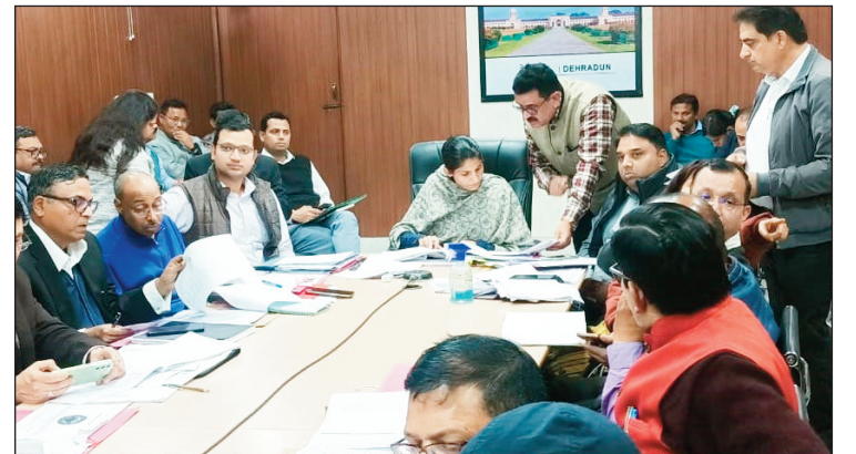
न्यूज़ वायरस नेटवर्क

देहरादून। राज्य सरकार के एक वर्ष पूर्ण होने पर प्रदेश स्तर पर 23 मार्च 2023 को 'जन सेवा' कार्यक्रम आयोजित किया जा रहा है। जनपद अवस्थित रेंजर्स ग्राउण्ड में मुख्य कार्यक्रम आयोजित किए जाएंगे, जिसमें माननीय मुख्यमंत्री पुष्कर सिंह धामी प्रदेशवासियों को सम्बोधित करेंगे। जिलाधिकारी सोनिका ने जनपद में प्रस्तावित 'जन सेवा' कार्यक्रम को सफल बनाने हेतु एनआईसी सभागार कलेक्ट्रेट में जिला स्तरीय अधिकारियों के साथ बैठक कर, कार्यक्रम दिशा-निर्देश दिए। उन्होंने मुख्य विकास अधिकारी को कार्यक्रम स्थल पर सूचना विभाग के साथ समन्वय करते हुए विभागों के स्टॉल लगवाकर जनकल्याणकारी योजनाओं से लाभान्वित करने के निर्देश दिए। मुख्य चिकित्साधिकारी को निर्देशित किया कि कार्यक्रम स्थल पर स्टॉल लगाकर निःशुल्क चिकित्सा परामर्श, जांच, दवाई वितरण आदि से जनमानस को लाभान्वित करना सुनिश्चित करेंगे। कृषि, पशु चिकित्सा, समाज कल्याण, महिला सशक्तीकरण एवं बाल विकास, उद्यान आदि