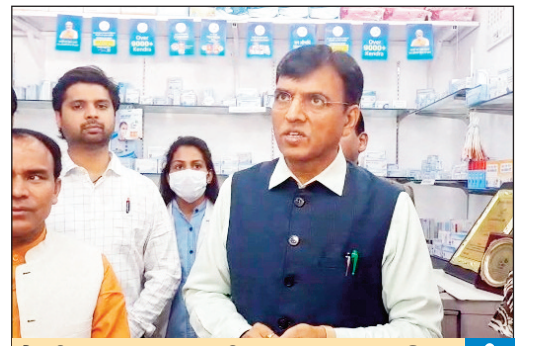
केंद्रीय स्वास्थ्य मंत्री मनसुख मांडविया ने किया जन औषधि केंद्र का निरीक्षण