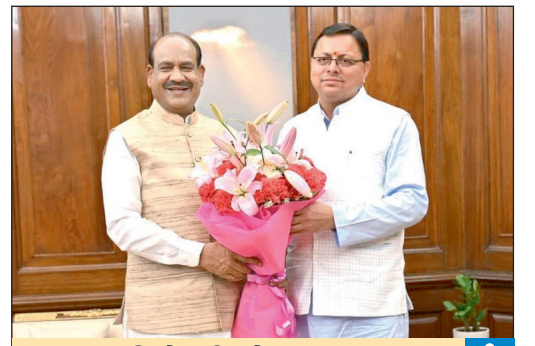
मुख्यमंत्री ने की लोकसभा अध्यक्ष ओम बिरला से शिष्टाचार भेंट