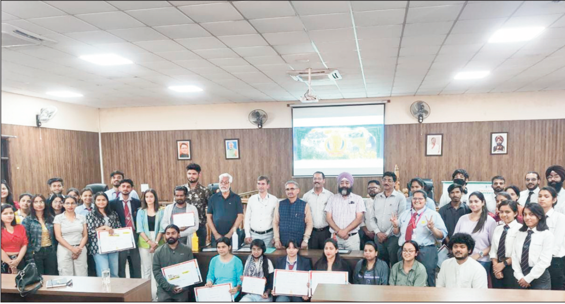
न्यूज़ वायरस नेटवर्क

नगर निगम देहरादून द्वारा वॉल पेंटिंग प्रतियोगिता की शुरुआत मार्च माह में की गई थी जिसका आज नगर निगम सभागार में प्रतिभागियों को सम्मानित कर समापन किया