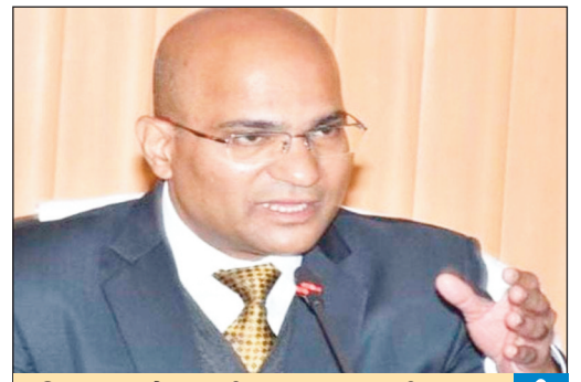
पुलिस जवानों, एसडीआरएफ व एनडीआरएफ की तैनाती के सम्बन्ध में चर्चा