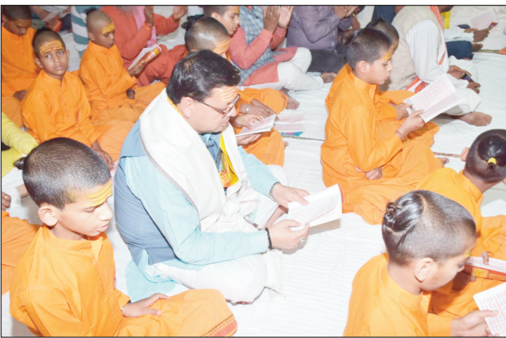
मुख्यमंत्री पुष्कर सिंह धामी ने टपकेश्वर महादेव मंदिर में पूजा - अर्चना कर प्रदेश एवं प्रदेशवासियों के सुख-समृद्धि की कामना की। इस अवसर पर मुख्यमंत्री ने शुभ मंगल चारधाम सेवा समिति द्वारा आयोजित सुंदरकांड में भी प्रतिभाग किया।