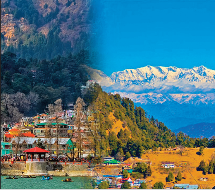
न्यूज़ वायरस नेटवर्क

उत्तराखंड 19 मई : गढ़वाली भाषा में बिनसर का मतलब नव प्रभात या नई सुबह होता है। अल्मोड़ा से मात्र 33 किमी दूर बिनसर एक बेहद शांत और खूबसूरत जगह है। देवदार के जंगलों से घिरा बिनसर समुद्र तल से करीब 2,200 मीटर की ऊंचाई पर