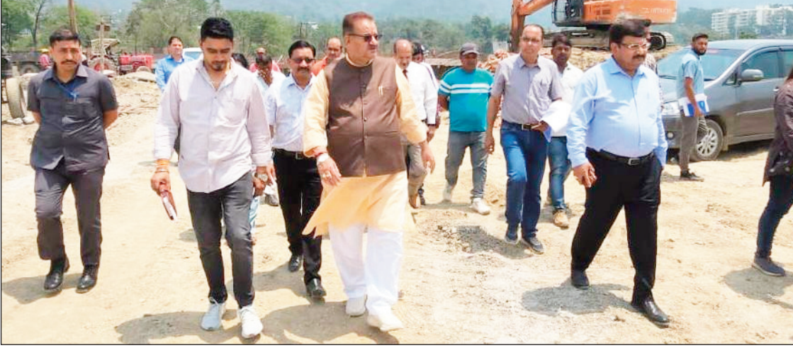
न्यूज़ वायरस नेटवर्क

उत्तराखंड 24 मई : सैनिक कल्याण मंत्री गणेश जोशी ने देहरादून के गुनियाल गांव में निर्माण हो रहे उत्तराखंड के पंचम धाम सैन्य धाम के निर्माण स्थल का विभाग के उच्च अधिकारियों के साथ निरीक्षण किया। सैनिक कल्याण मंत्री ने निरीक्षण के दौरान मौके पर मौजूद अधिकारियों से निर्माण कार्यों को प्रगति की जानकारी ली। अधिकारियों द्वारा विभागीय मंत्री को अवगत कराया गया कि सैन्य धाम का निर्माण कार्य लगभग 50 प्रतिशत से अधिक पूर्ण हो गया है। मंत्री ने अधिकारियों को निर्माण कार्य को गुणवत्ता के साथ ही निर्माण कार्य को तेजी से करने के निर्देश दिए। मंत्री ने अधिकारियों को सैन्य धाम के निर्माण कार्य को दिन-रात कार्य