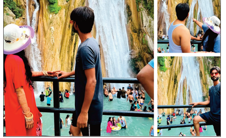
न्यूज़ वायरस नेटवर्क

नैनीताल 24 मई : उत्तराखंड के हिल स्टेशन इन दिनों सैलानियों से गुलजार हैं। तपती गर्मी में लोग राहत पाने के लिए नैनीताल-मसूरी जैसे शहरों का रुख कर रहे हैं। टिहरी में भी लोग बड़ी संख्या में बोटिंग करने पहुंच रहे हैं। इससे पहाड़ी शहरों में भीड़-भाड़ नजर आ रही है। बच्चे गर्मियों की छुट्टियां एंजॉय करने के लिए नैनीताल-टिहरी जैसे शहरों में पहुंच रहे हैं। नैनीताल में लगभग सभी होटल पैक हैं। वीकेंड पर यहां पार्किंग फुल रही। पुलिस ने पर्यटक वाहनों का शहर में प्रवेश वर्जित कर दिया। पर्यटकों को शटल सेवा से शहर तक भेजा गया। बीते दिन भी मुक्तेश्वर, भीमताल, सातताल, रामगढ़ व भवाली जैसे क्षेत्र भी पर्यटकों से गुलजार