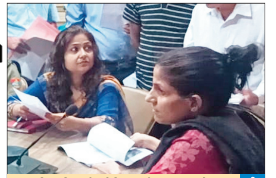
जिलाधिकारी सोनिका की अध्यक्षता में जनसुनवाई कार्यक्रम का आयोजन किया गया