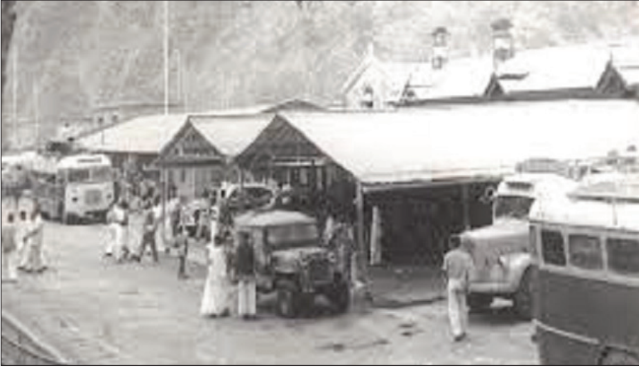
न्यूज़ वायरस नेटवर्क

ब्यूरो रिपोर्ट, 24 जून, यह वह दौर था, जब पूरा क्षेत्र जंगलों से घिरा हुआ था, बाघ, तेंदुओं और हाथी की दहशत हुआ करती थी। पहाड़, नदी और जंगल से घेरा नैनीताल की तलहटी में बसा यह इलाका प्राकृतिक सौंदर्य से परिपूर्ण हुआ करता था। पहाड़ को मौदान से जोड़ने वाला यह आखिरी स्टेशन तब से एक भी कदम और आगे पहाड़ न चढ़ सका है।