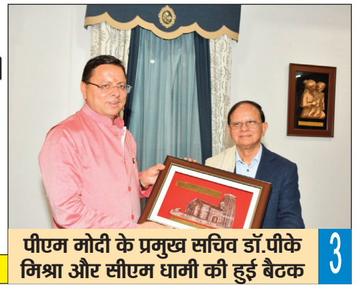
पीएम मोदी के प्रमुख सचिव डॉ. पीके मिश्रा और सीएम धामी की हुई बैठक