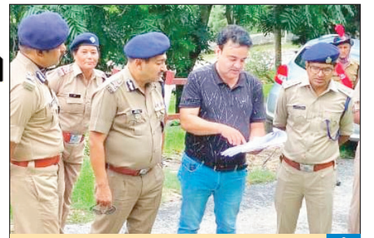
डीजीपी ने प्रस्तावित प्रशासनिक भवन के निर्माण के लिए चयनित भूमि का किया निरीक्षण