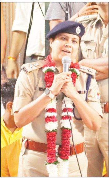
न्यूज़ वायरस नेटवर्क

पौड़ी, 2 अगस्त, आप अक्सर पुलिस की ढुलमुल कार्यवाही, सुस्त जांच और निराशाजनक व्यवहार की खबरें सुनते होंगे। हांलाकि खाकी के बारे में भले ही अन्य प्रदेशों में अलग अलग रे नज़र आती हो लेकिन कम से कम उत्तराखंड जैसे पर्यटन प्रदेश में अक्सर बेहतरीन पुलिसिंग और शानदार पुलिस अफसरों की कहानियां सोशल मीडिया से लेकर आम जन जीवन में सुनाई और दिखाई देती है। ऐसे ही एक खबर आयी है पौड़ी से, जहाँ खाकी को गुलाब की माला पहना कर शुक्रिया कहा गया है।