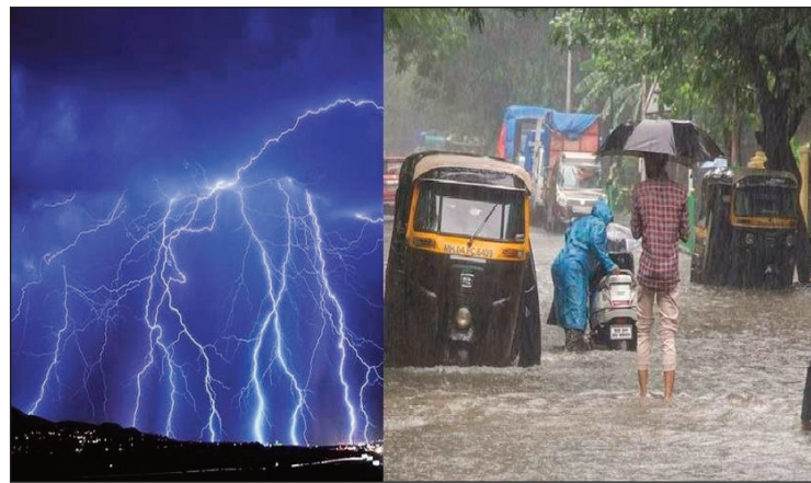
सामार - सी.मी.

6 अगस्त तक खराब मौसम मुश्किलें बढ़ाता रहेगा। इस दौरान पर्वतीय इलाकों में भारी बारिश होती रहेगी। देहरादून के कुछ हिस्सों में तेज बारिश के एक या दो दौर हो सकते हैं। यहां तापमान में लगातार उतार-