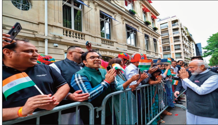
साभार - सो.मी.

फ्रांस लगातार वैज्ञानिकों, प्रबंधकों, इंजीनियरों, विचारकों, कलाकारों और लेखकों के बीच एक पसंदीदा अध्ययन और कार्यस्थल रहा है। देश की जीवंत सांस्कृतिक छवि और गहरी जड़ें रोजमर्रा के अस्तित्व में व्याप्त हैं, जबकि अंतर-राष्ट्रीय छात्रों को गले लगाने के लिए इसका अटूट समर्पण, असाधारण शिक्षा के