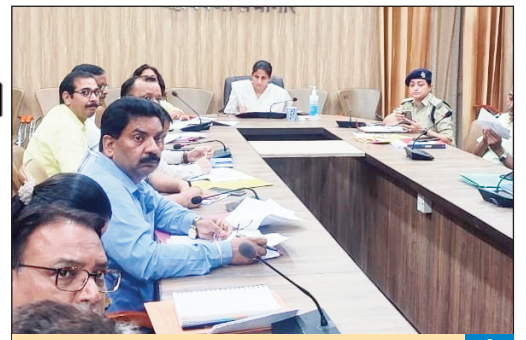
मेरी माटी मेरा देश अभियान के जनपद में सफलता पूर्वक आयोजन को लेकर डीएम की अध्यक्षता में हुई बैठक