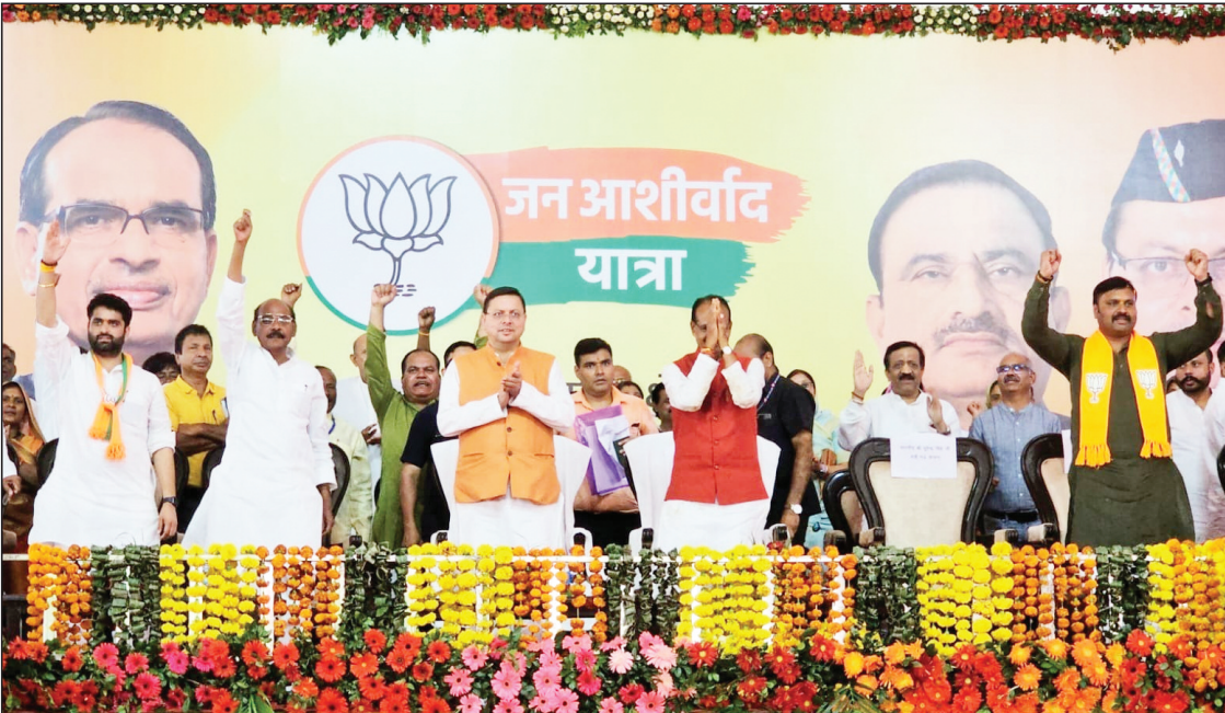
न्यूज़ वायरस नेटवर्क देहरादून से मो० सलीम सैफ़ी की विशेष रिपोर्ट

देहरादून, 21 सितंबर, उत्तराखंड के मुख्यमंत्री पुष्कर सिंह धामी को मध्य प्रदेश और राजस्थान के चुनावी दौरे पर मिल रही लोकप्रियता आज उनके शिखर पर पहुंचते कद और प्रभाव का आइना है। सीएम धामी की बढ़ती लोकप्रियता और उत्तराखंड में बतौर सीएम लिए गए बड़े फैसलों के बाद से धामी की चुनावी राज्यों में डिमांड बढ़ गई है। जिसको धामी की भाजपा संगठन में बढ़ते कद के रूप में माना जा रहा है। दरअसल पुष्कर फूल भी है और फायर भी .... पुष्कर कड़क भी आक्रामक भी और यही वजह है कि अब तक के सभी मुख्यमंत्रियों में सीएम धामी ने उत्तराखंड में 2 साल के कार्यकाल में अभूतपूर्व फैसलों से देश भर में उत्तराखंड की नई और ऊँची पहचान बनाई है।