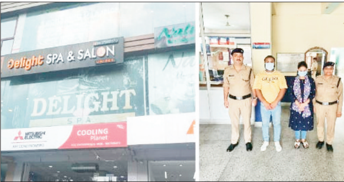
न्यूज़ वायरस नेटवर्क

देहरादून 22 सितम्बर : पुलिस अधीक्षक देहरादून को नगर क्षेत्रान्तर्गत कुछ स्पा सेंटरों में अनैतिक कार्य किये जाने की गोपनीय सूचना प्राप्त हुई थी, जिस पर उनके द्वारा तत्काल AHTU टीम को उक्त स्थानों की आकरिमक चेकिंग कर आवश्यक वैधानिक कार्रवाई करने निर्देश दिए गए। उक्त आदेशों के क्रम में दिनांक 20/09/23 की शाम AHTU देहरादून की टीम द्वारा चकराता रोड़ स्थित स्पा सेंटरों की आकरिमक चेकिंग की गई। दौरान चेकिंग टीम को बिंदाल क्षेत्र स्थित क्राउन टावर में डिलाइट स्पा सेंटर पर मसाज की आड़ में एक कमरे में एक महिला व एक पुरुष अनैतिक देह व्यापार में संलिप्त मिले, साथ ही तीन अन्य महिलाये भी उक्त स्पा सेंटर में मौजूद मिली, स्पा सेंटर की तलाशी में वहां से कई आपत्तिजनक चीजे प्राप्त हुई। जिस पर पुलिस टीम द्वारा मौके से स्पा सेंटर की महिला मैनेजर तथा एक पुरुष को अनैतिक देह व्यापार अधि0 के तहत गिरफ्तार किया तथा तीन पीड़ित महिलाओ को रेस्क्यू किया गया।