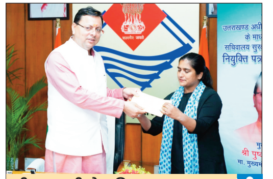
सीएम धामी ने सचिवालय सुरक्षा दल के 15 रक्षकों को नियुक्ति पत्र सौंपे