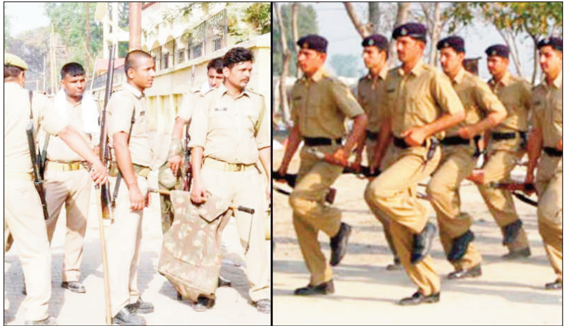
कपूर - से.मी.

विभिन्न मेलों, त्योहारों, यातायात, शांति व्यवस्था, यात्रा सीजन, बोर्ड परीक्षाओं व चुनाव के दौरान भी यह अपना योगदान देते हैं। राज्य में होमगार्ड सचिवालय समेत कई विभागों में अपनी सेवा दे रहे हैं।