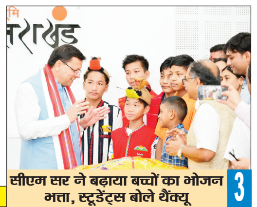
सीएम सर ने बढ़ाया बच्चों का भोजन मत्ता, स्टूडेंट्स बोले थेक्यू