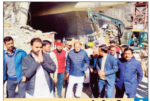
भाजपा महानगर अध्यक्ष ने की पार्टी कार्यकर्ताओं के परिवारों को शिष्टाचार भेंट