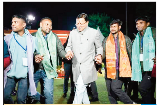
पीएम की मदद न मिलती तो फेल हो जाता सिलक्यारा अभियान : धामी