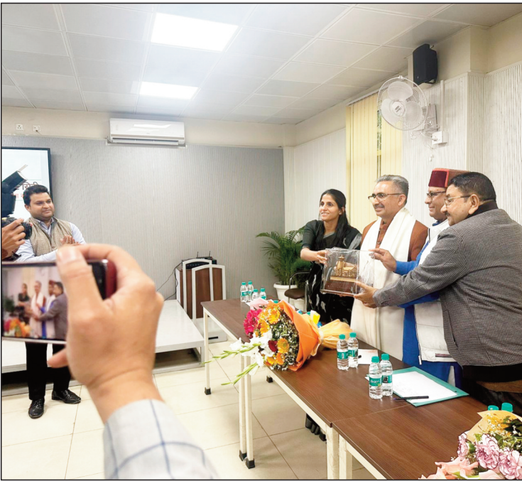
न्यूज़ वायरस नेटवर्क