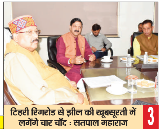
टिहरी रिगरोड से झील की खूबसूरती में लगेगे चार चाँद : सतपाल महाराज