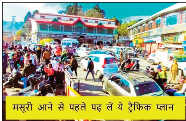
मसूरी आने से पहले पढ़ लें ये ट्रेफिक प्लान

देहरादून की ओर जाने वाले वाहनों को नगर पालिका कार्यालय से होते हुए पिक्चर पैलेस बस अड्डे की ओर डायवर्ट किया जायेगा। लाइब्रेरी से पिक्चर पैलेस की तरफ जाने वाले वाहनों को अम्बेडकर चौक (घोडा स्टैंड) से कैमल बैक रोड की तरफ डायवर्ट किया जाएगा। मसूरी से देहरादून जाने वाले वाहनों को किंग ग्रेग से होते हुए जेपी बेंड से बालोंगंज की तरफ डायवर्ट कर झड़ीपानी की ओर से देहरादून की ओर भेजा जायेगा। पिक्चर पैलेस की ओर से जाने वाले वाहनों को बड़ा मोड़ से वाइन वर्ग एलन स्कूल होते हुए बालोंगंज की