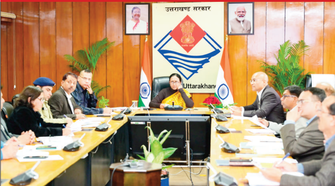
न्यूज़ वायरस नेटवर्क

राज्य में ट्रेकिंग के लिए आने वाले पर्यटकों की पुख्ता सुरक्षा व्यवस्था को लेकर शासन-प्रशासन की तैयारियां शुरू