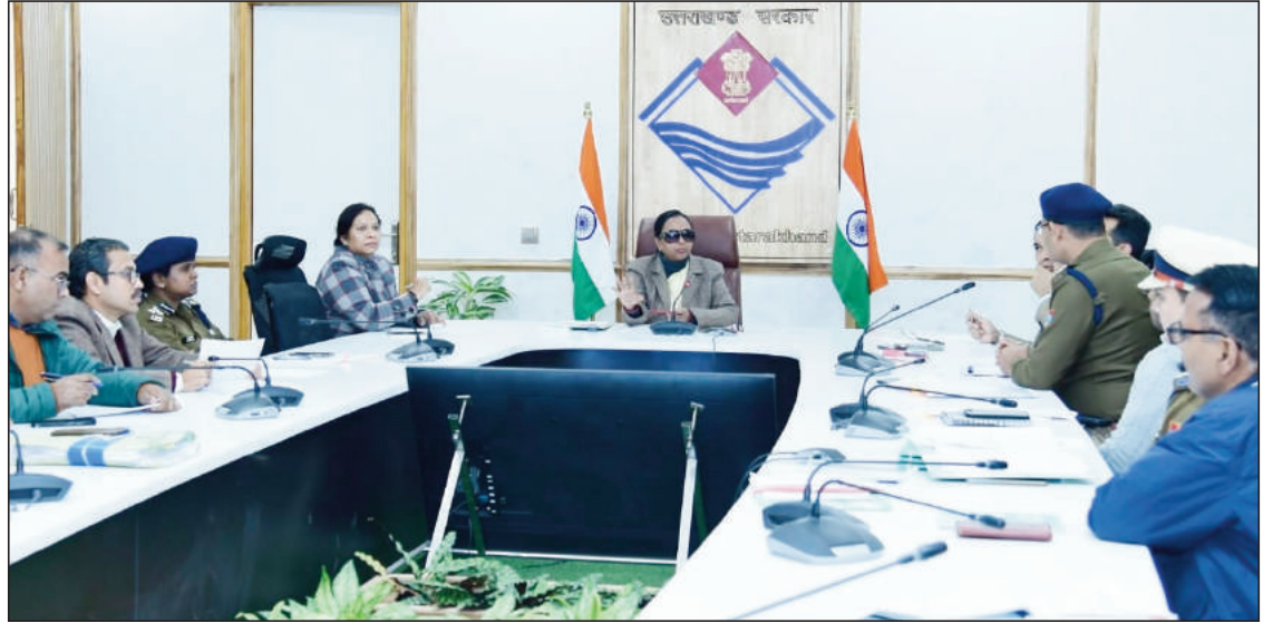
एसआईएसएफ (राज्य औद्योगिक सुरक्षा बल) के गठन की कार्यवाही को तीव्र करने के निर्देश

कर्मियों के स्पष्ट प्रस्ताव को शीघ्र गृह विभाग को भेजने के निर्देश पुलिस विभाग को दिए हैं। सचिवालय में आयोजित इस महत्वपूर्ण बैठक में एसीएस राधा रतूड़ी ने उत्तराखण्ड में सार्वजनिक प्रतिष्ठानों, बैंकों, हैलीपैड, हैलीपोर्ट, औद्योगिक आस्थानों की सुरक्षा के लिए गठित की जाने वाली एसआईएसएफ (राज्य औद्योगिक सुरक्षा बल) के गठन की कार्यवाही को तीव्र करने के निर्देश पुलिस, होमगार्ड्स एवं अन्य सम्बन्धित विभागों को दिए। बैठक में उन्होंने इससे सम्बन्धित सभी लंबित प्रस्तावों की समीक्षा की। अपर मुख्य सचिव ने कहा कि मुख्यमंत्री पुष्कर सिंह धामी ने राज्य में केन्द्रीय