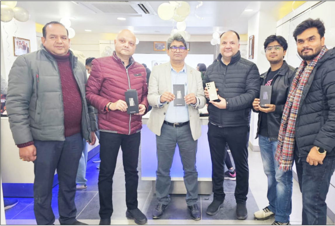
Galaxy S24 Ultra Com o poder do Galaxy IA