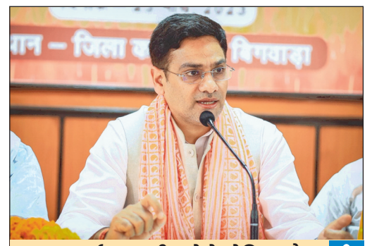
यात्रा मार्ग पर नहीं चलेंगे चोटिल और अस्वस्थ घोड़े : सौरभ बहुगुणा