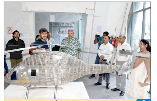
उत्तरा आर्ट गैलरी के निरीक्षण में महाराज ने दिए संरक्षण के निर्देश