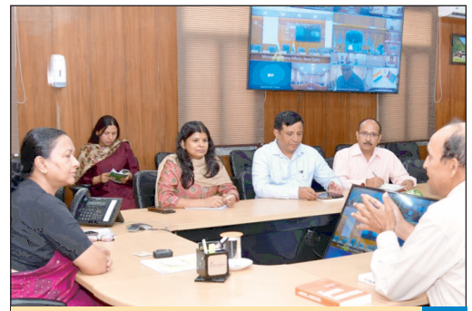
लैब्स ऑन व्हील्स" मोबाइल साइंस लैब प्रोजेक्ट 4 जिलों में आरम्भ किया जाएगा : मुख्य सचिव