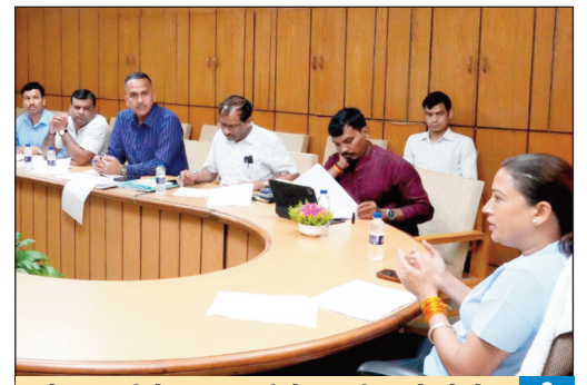
खेल मंत्री रेखा आर्या ने राष्ट्रीय खेलों के आयोजन के संबंध में समीक्षा बैठक की