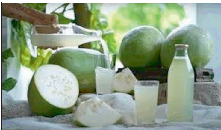
पाचन तंत्र को बनाता है मजबूत आंतों पाचन तंत्र में अहम भूमिका निभाती

ब्यूरो रिपोर्ट, 2 अगस्त, गर्मियों के मौसम सफेद पेठा खूब खाया जाता है। कोई इसकी सब्जी बनाकर खाता है तो कोई इसकी मिठाई। लेकिन इसके अलावा कई लोग इसका जूस बनाकर भी पीते हैं। मिनरल्स से भरपूर सफेद पेठा न केवल आपको हाइड्रेटेड रखता है बल्कि आपकी स्किन को भी ग्लोइंग बनाता है। पेठे के जूस में कम कैलोरी और विटामिन मौजूद होता है जो इसे हेल्दी बनाता है और सबसे बड़ी बात ये है कि ये जूस स्वाद में बिल्कुल भी कड़वा नहीं होता है। जिसकी वजह से लोग इसे रोजाना बड़े चाव से पीते हैं। ऐसे में आइए जानते हैं सफेद पेठे के जूस के क्या-क्या फायदे हैं।