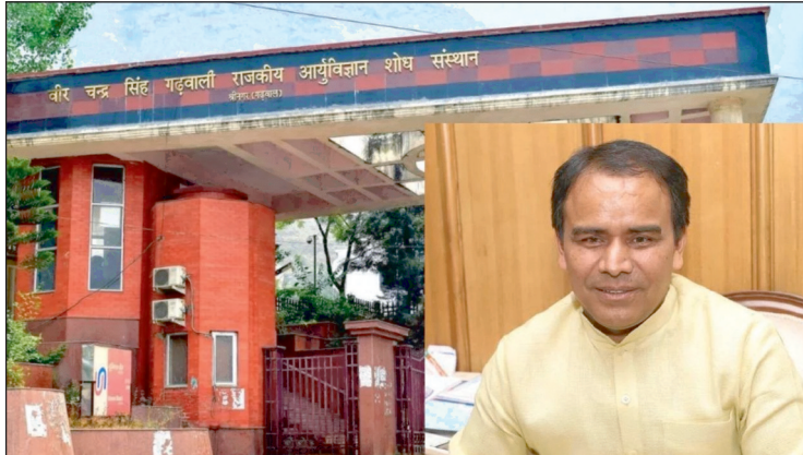
हेमवती नंदन बहुगुणा उत्तराखंड चिकित्सा शिक्षा विश्वविद्यालय के कुलपति की अध्यक्षता में गठित साक्षात्कार/चयन समिति द्वारा श्रीनगर मेडिकल कॉलेज के

देहरादून, 2 अगस्त, प्रदेश के मेडिकल कॉलेजों में फैकल्टी की कमी को दूर करने के दृष्टिगत चिकित्सा शिक्षा विभाग द्वारा संविदा के आधार पर मेडिकल फैकल्टी की नियुक्ति की जा रही है। इसी क्रम में वीर चन्द्र सिंह गढ़वाल राजकीय आयुर्विज्ञान एवं शोध संस्थान श्रीनगर में राज्य सरकार ने विभिन्न संकायों के अंतर्गत चार मेडिकल फैकल्टी तथा दो कैज्युअल्टी मेडिकल ऑफिसर की नियुक्ति को मंजूरी प्रदान की है। नई मेडिकल फैकल्टी की नियुक्ति से जहां मेडिकल कॉलेज में फैकल्टी की कमी दूर होगी वहीं शैक्षणिक गतिविधियों में सुधार आयेगा।