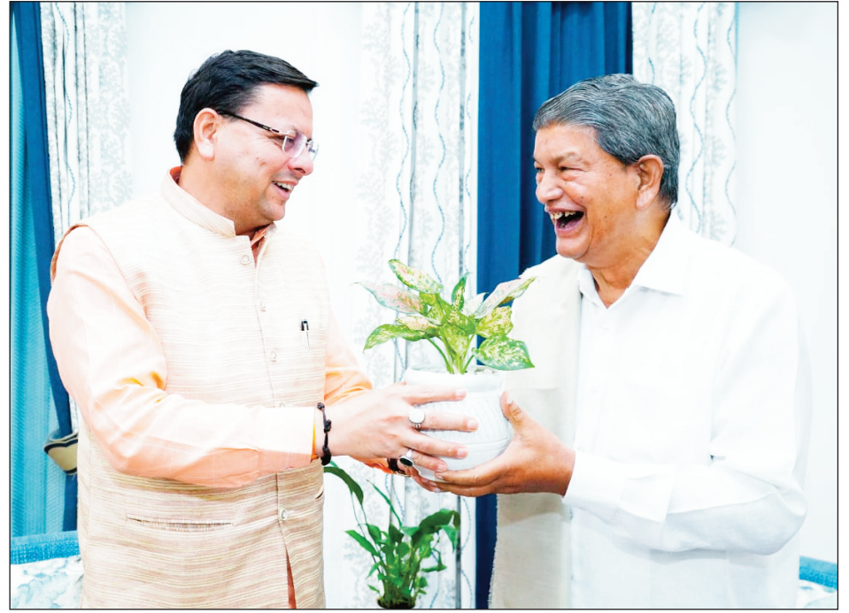
मुख्यमंत्री पुष्कर सिंह धामी से मुख्यमंत्री आवास में प्रदेश के पूर्व मुख्यमंत्री हरीश रावत ने भेंट की। इस दौरान दोनों दिग्गजों ने मौजूदा प्रदेश के हालात, आपदा और चार धाम यात्रा पर मंत्रणा की।