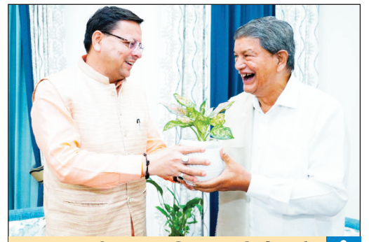
मुख्यमंत्री पुष्कर सिंह धामी से पूर्व सीएम हरीश रावत ने भेंट की