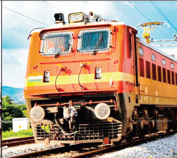
शक्तिनगर): 15 अगस्त को डायवर्ट। 15073 त्रिवेणी एक्सप्रेस (सिंगरौली-टनकपुर): 13, 14 और 15 अगस्त को