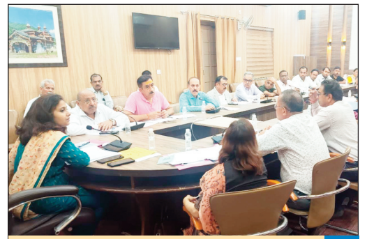
सीडीओ कमठान की अध्यक्षता में हुई उद्योग मित्र समिति की बैठक