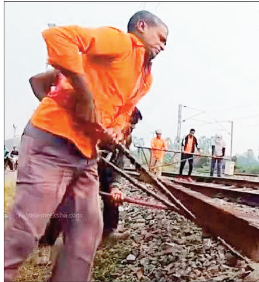
(टनकपुर-सिंगरौली): 14 और 16 अगस्त को डायवर्ट।

13 से 16 अगस्त तक ट्रेनें के रूट में बदलाव: 15074 त्रिवेणी एक्सप्रेस