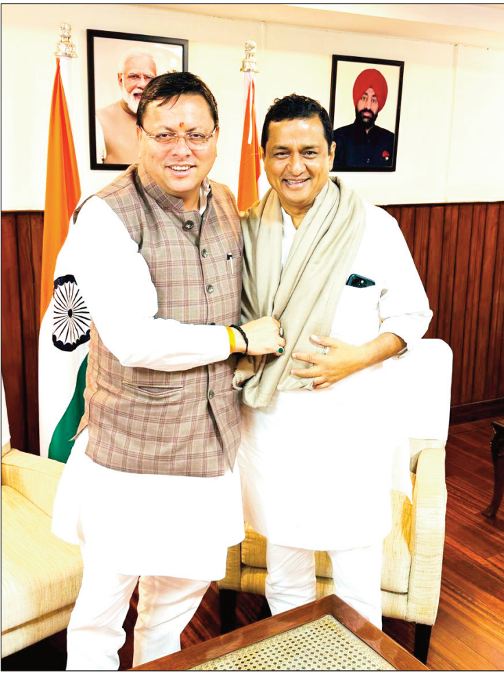
प्रदेश के मुख्यमंत्री पुष्कर सिंह धामी और गढ़वाल सांसद अनिल बलुनी की दिल्ली उत्तराखंड सदन में शिष्टाचार भेंट हुई, जिसमें दोनों नेताओं ने राज्य के विकास, अतिवृष्ट के कारण हुई आपदा एवं राहत कार्यों सहित विभिन्न मुद्दों के संबंध में विचार विमर्श हुआ।