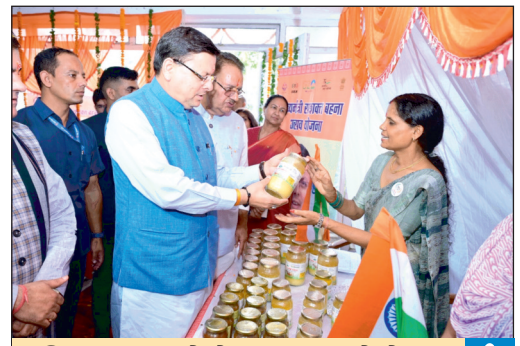
महिलाएं समूहों के माध्यम से बेहतर उत्पाद बना रही हैं : धामी